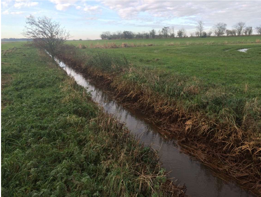
Foto fra besigtigelsen af den strækning, der skal rørlægges.

Vegetationen vil forsvinde fra en ti m lang strækning, når vandløbet under overkørslen bliver rørlagt. Esbjerg Kommune betragter dog rørlægningen som en forholdsvis lille del af det ret ensartede vandløb.